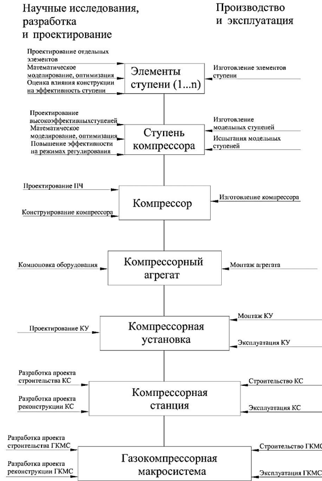
Рис. 1. Иерархическая структура объектов компрессорной индустрии Fig. 1. Hierarchical structure of compressor industry facilities

логического процесса, особенностями технологических установок, в составе которых функционируют компрессоры, а также воздействием внешних факторов.